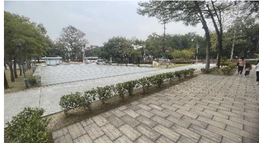
人文廣場上方緩衝平台區