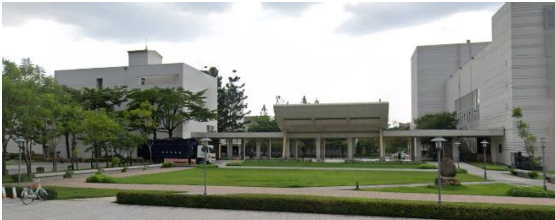
活動草坪前方木紋磚敷地