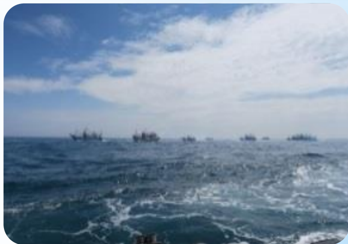
友港漁船迎接繞港