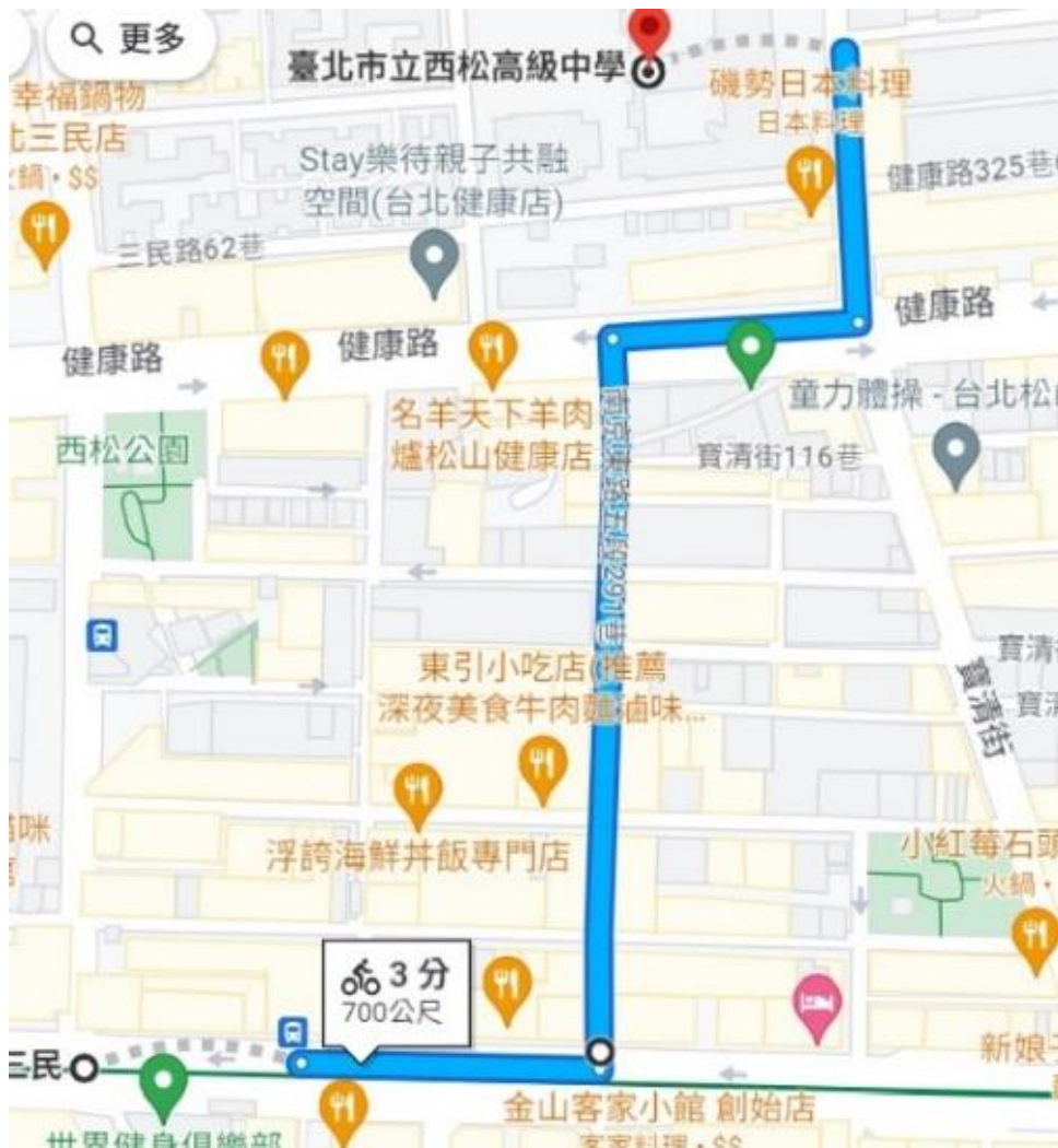
(南京三民捷運站4號出口 > 本校 路線指引圖)

三、火車搭乘資訊：【松山車站】轉乘捷運松山信義線【南京三民站】或公車八德路出口轉乘民生幹線(原518)、63、棕1路線公車，至發電所(西松高中)站。