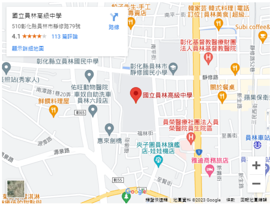
員林高中校園平面圖