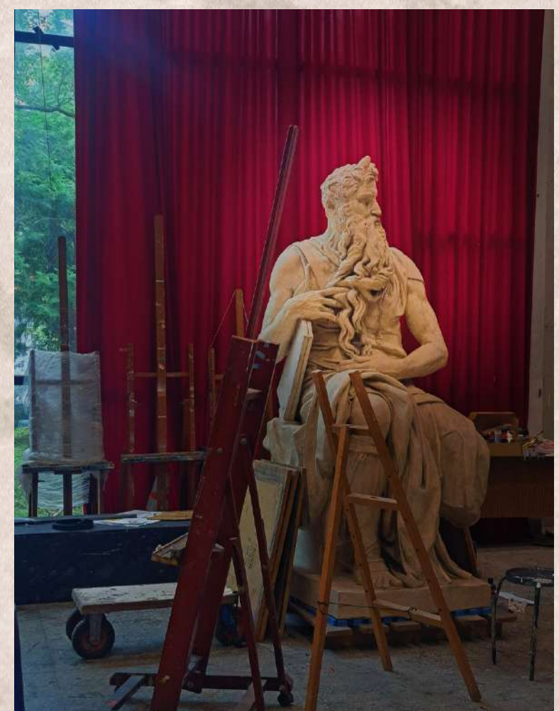
北藝裡的菲斯雕像