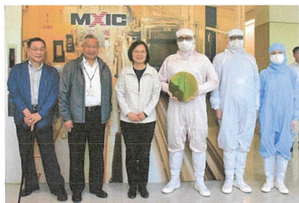
蔡英文總統親臨旺宏參觀，肯定旺宏的研發實力與成果