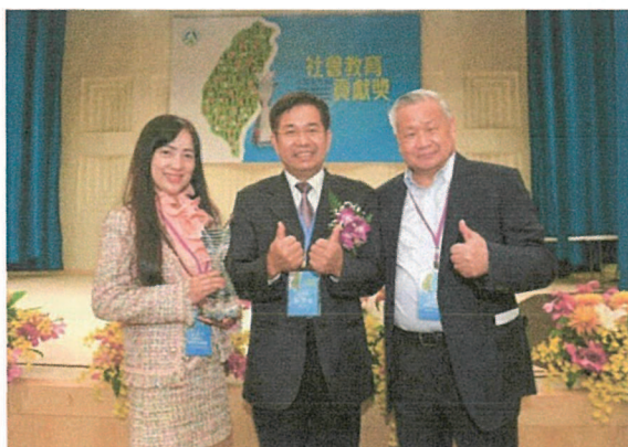
2021年基金會因長期推動國內科學教育，由教育部潘文忠部長頒授「社會教育貢獻獎」的肯定

「旺宏科學獎」強調創新，希望打造公平公正公開的競賽平臺，並透過高額獎學金制度，激發每位參賽同學的創意潛能。期許未來能持續影響年輕世代勇敢天馬行空，務實動手實踐，厚植臺灣基礎科學實力。