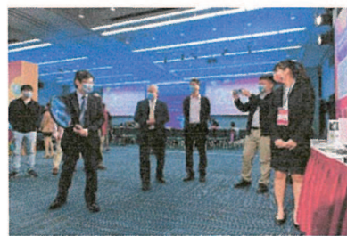
科技部次長陳宗權體驗獲獎學設計創意作品